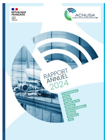
Rapport annuel 2024

La part des vols de nuit a oscillé entre 3,7% en décembre et mars (1 jour de moins) et 4,2% en janvier, la différence tenant au faible trafic de jour en janvier. La moyenne mensuelle a atteint 3,9%.