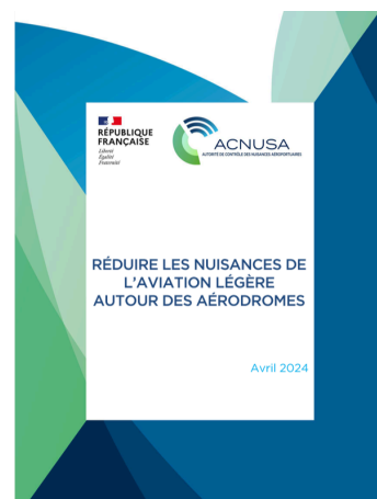
Réduire les nuisances de l'aviation légère